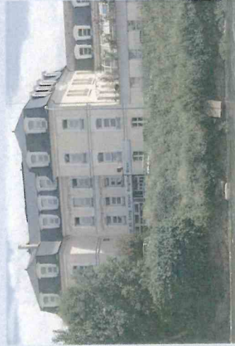
CMP Meulan 1 quai Albert 1 er - 78250 Meulan-en-Yvelines